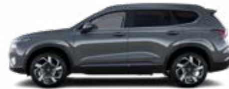
Magnetic Gray Metallic