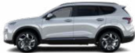
Glacier White Metallic