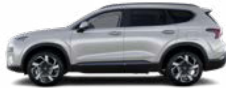
Typhoon Silver Metallic