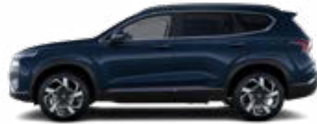
Lagoon Blue Pearl