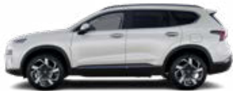
Creamy White Pearl