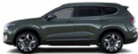
Forest Gray Metallic