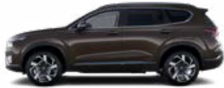
Taiga Brown Pearl