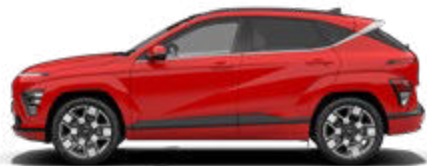
Engine Red Solid