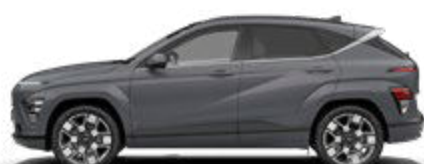
Ecotronic Gray Pearl